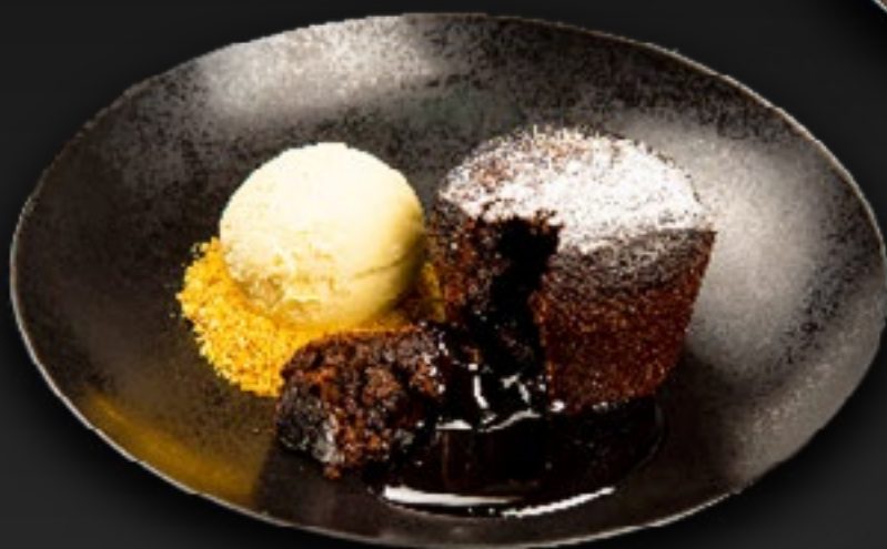
ШОКОЛАДНЫЙ ФОНДАН с ванильным мороженым