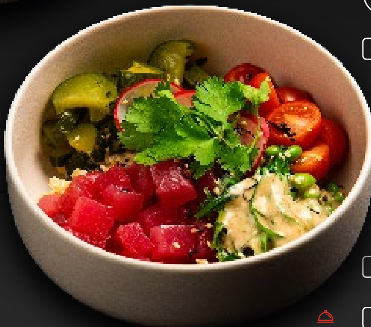
ПОКЕ С ТУНЦОМ 790