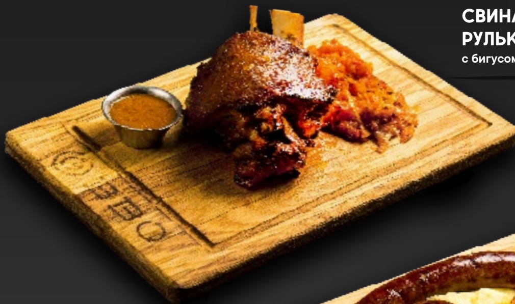
СВИНАЯ 1950 РУЛЬКА с бигусом