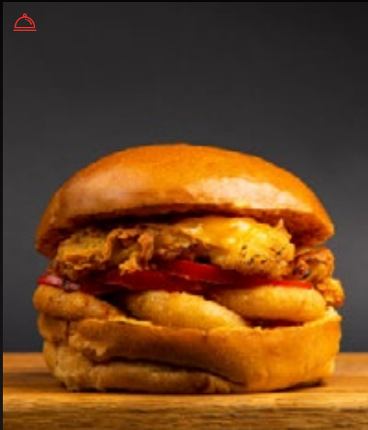
БУРГЕР С КУРИНЫМИ СТРИПСАМИ 690