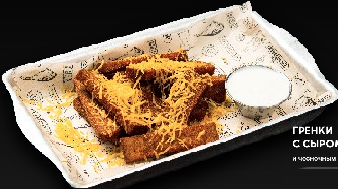
ГРЕНКИ С СЫРОМ 390 и чесночным соусом