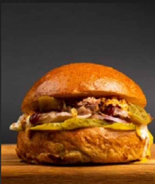
БУРГЕР С РВАНЫМ МЯСОМ 750

котлетой из мраморной говядины, сыром чеддер и луковым мармеладом