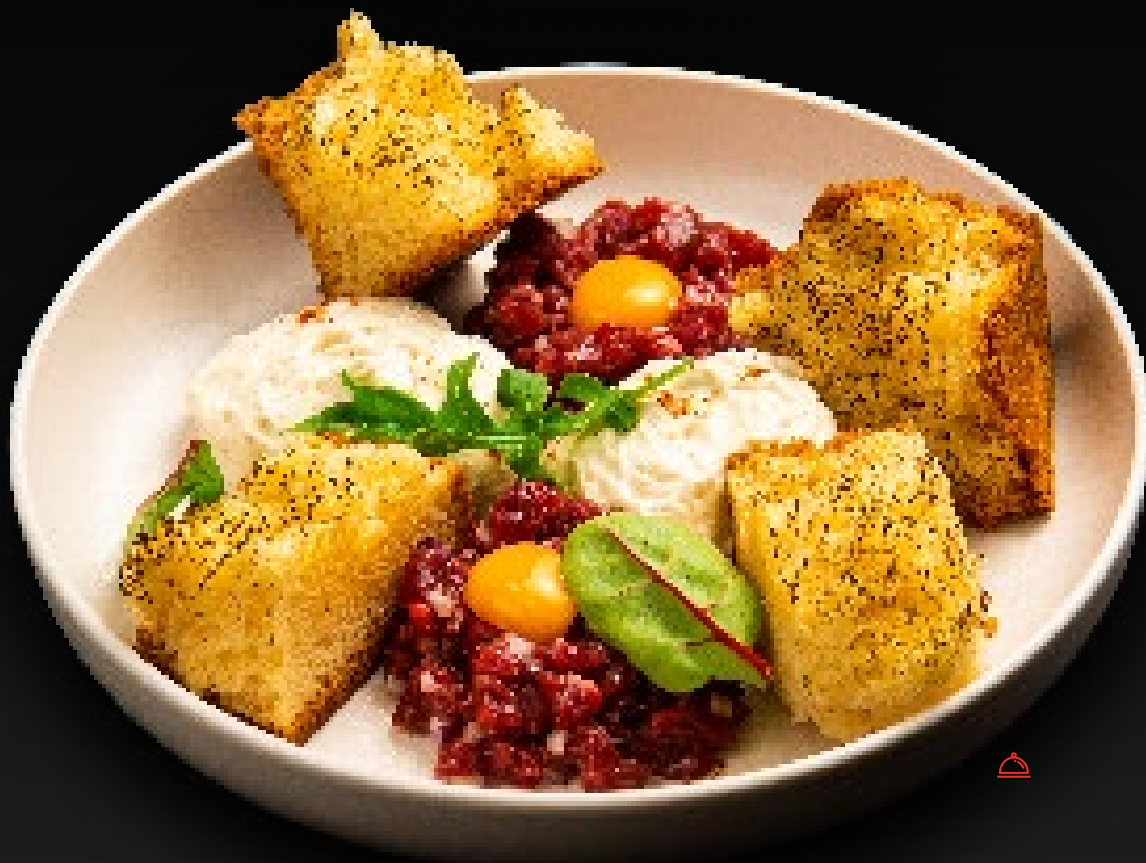
ТАРТАР ИЗ ГОВЯДИНЫ