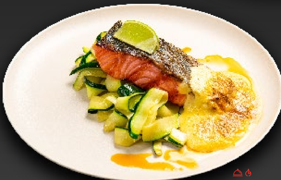
СТЕЙК ИЗ МОРСКОЙ ФОРЕЛИ 1350 с тальятелле из цукини и соусом бешарнез