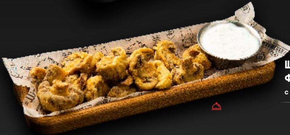
ШАМПИНЬОНЫ ФРИ 550 с трюфельной сметаной