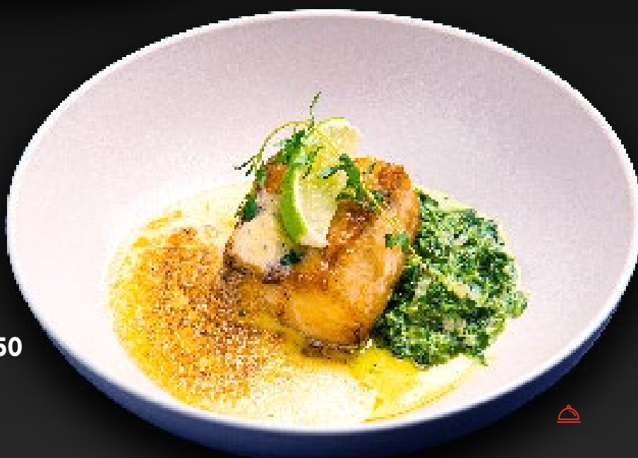
КЛЫКАЧ СО ШПИНАТОМ 1250 в сливках и соусом бешарнез