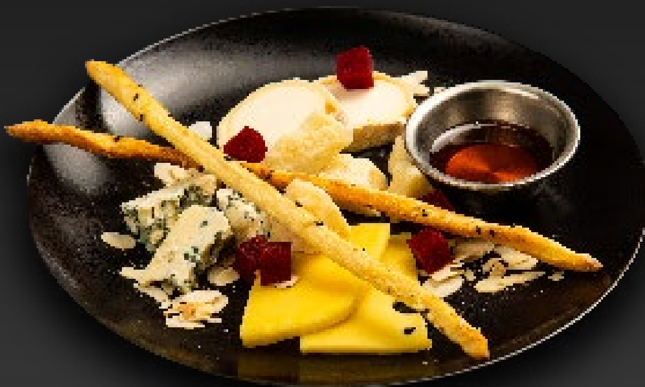
СЕТ СЫРОВ 960