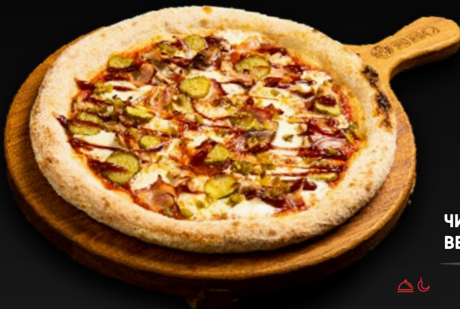
ЧИКЕН 850 BBQ