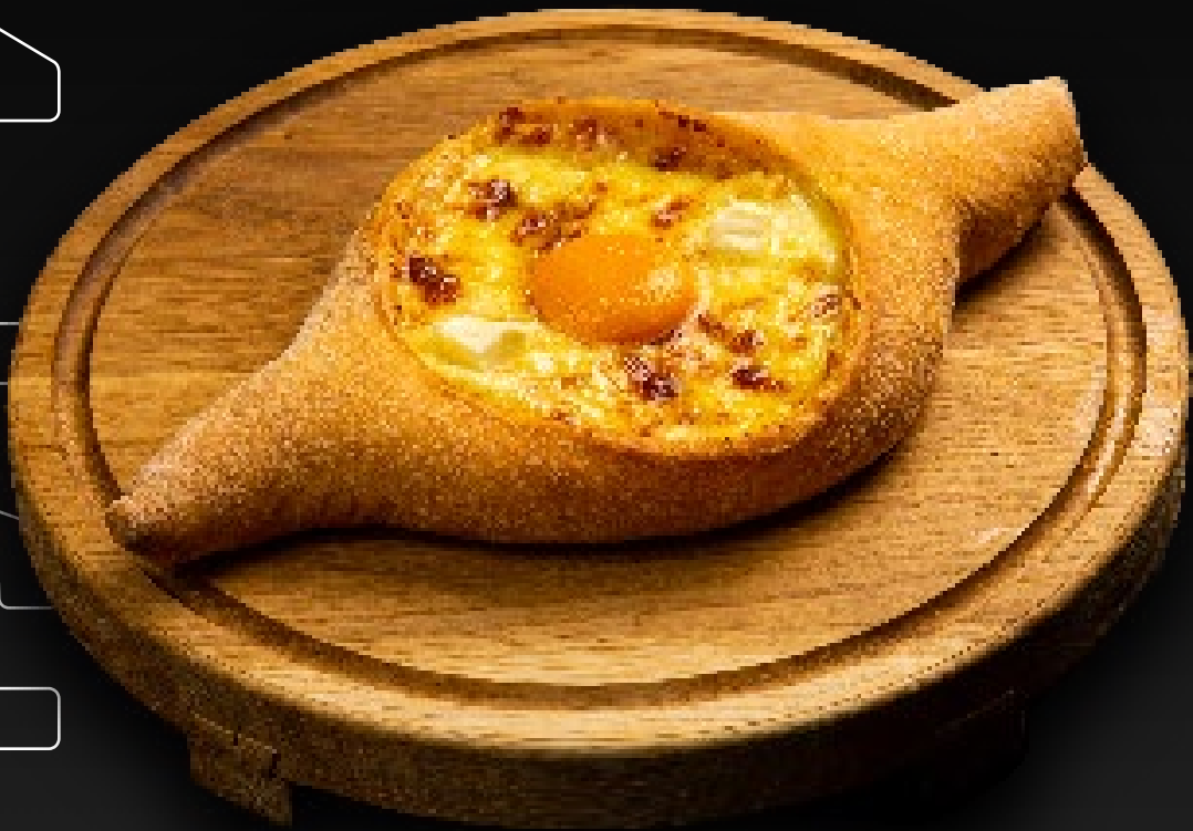
ХАЧАПУРИ 630 по-аджарски