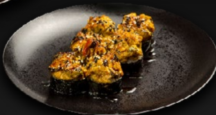
ЗАПЕЧЕННЫЙ РОЛЛ С МИДИЯМИ 490