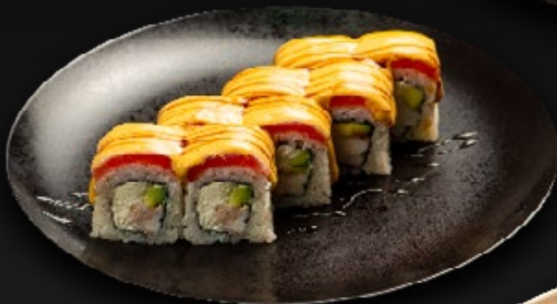
РОЛЛ ТЕМПУРА С КУРИЦЕЙ 490