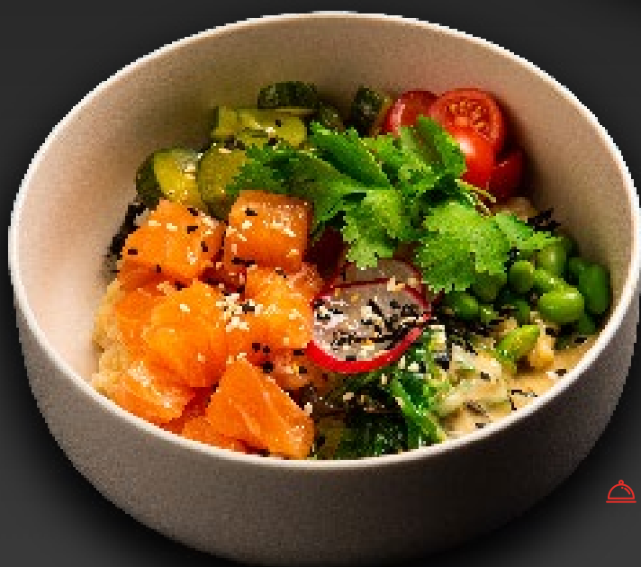
ПОКЕ С ЛОСОСЕМ 890