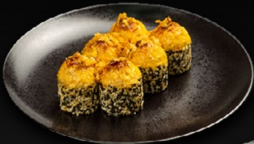
ЗАПЕЧЕННЫЙ РОЛЛ С ГРИБАМИ И КУРИЦЕЙ 450