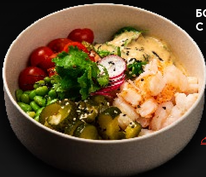
БОУЛ С КРЕВЕТКАМИ 850