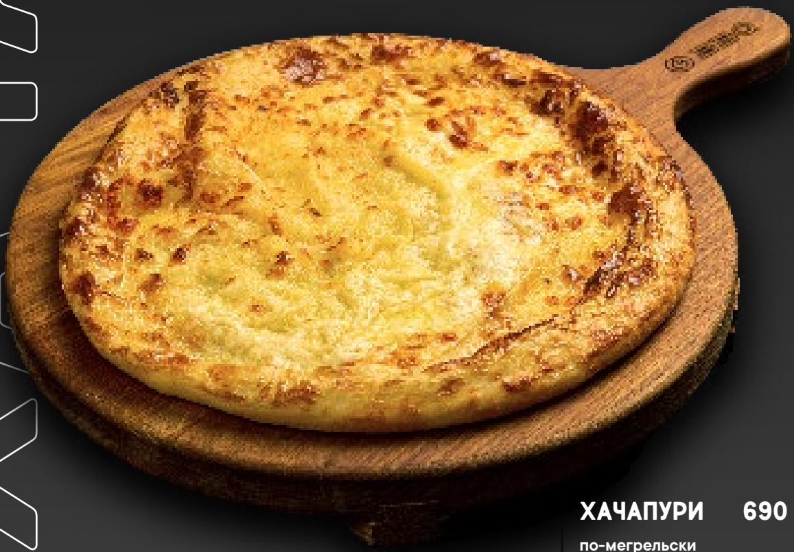
ХАЧАПУРИ 690 по-мегрельски