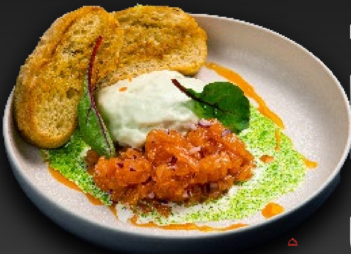
ТАРТАР ИЗ МОРСКОЙ ФОРЕЛИ с соусом сливочный васаби