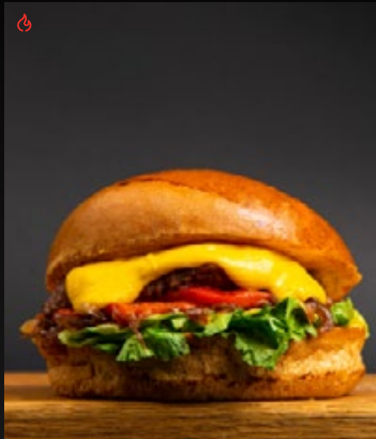
ЧИЗБУРГЕР С ПЕЧЕНЫМ ПЕРЦЕМ 750

котлетой из мраморной говядины, сыром чеддер и луковым мармеладом