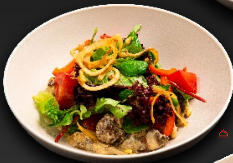
ЦЕЗАРЬ 690 с куриным филе