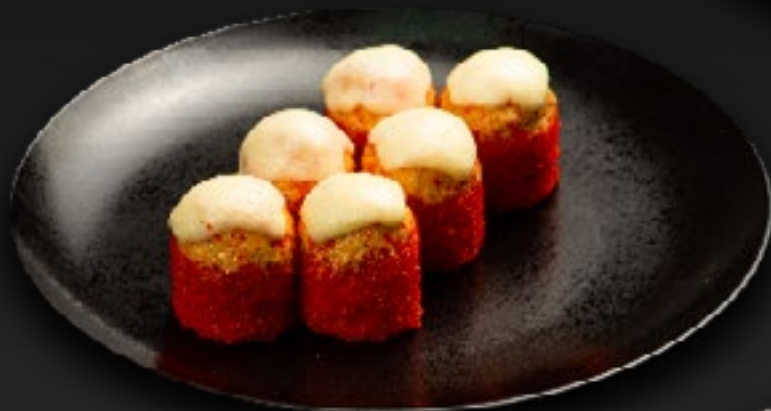
ЗАПЕЧЕННЫЙ РОЛЛ СО СНЕЖНЫМ КРАБОМ 590 под сырной шапкой