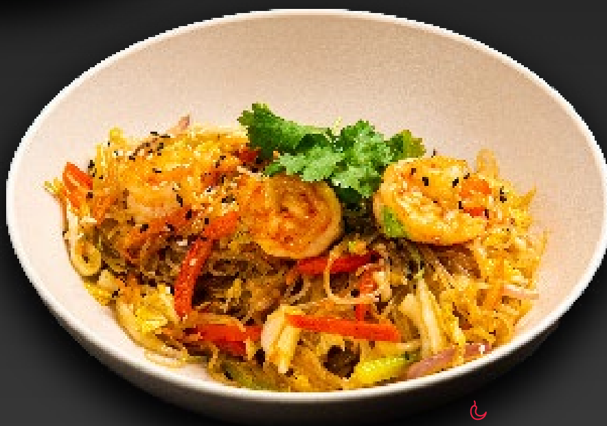
ВОК С ТИГРОВЫМИ КРЕВЕТКАМИ 890 лапша на выбор/рис