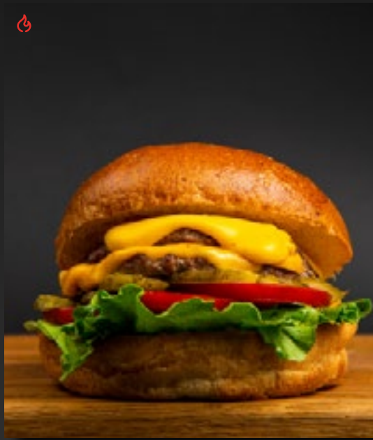
БОЛЬШОЙ КЛАССИЧЕСКИЙ БУРГЕР BBQ 850

свиной рульки, маринованными огурцами и халапеньо