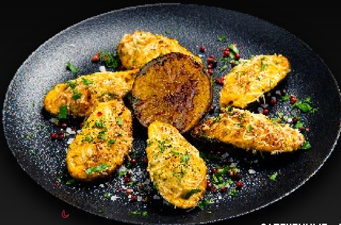
ЗАПЕЧЕННЫЕ 750 МИДИИ 6 штук