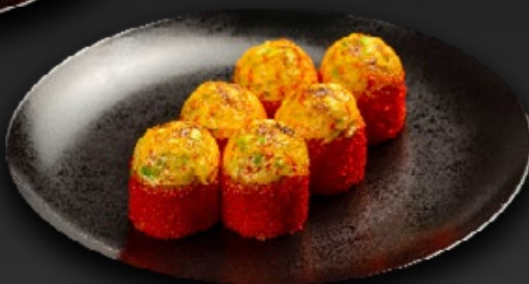
ЗАПЕЧЕННЫЙ РОЛЛ С КРЕВЕТКАМИ И АВОКАДО 650