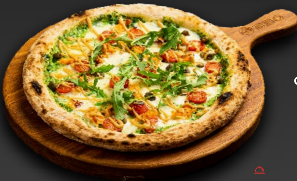
С ЛОСОСЕМ 980