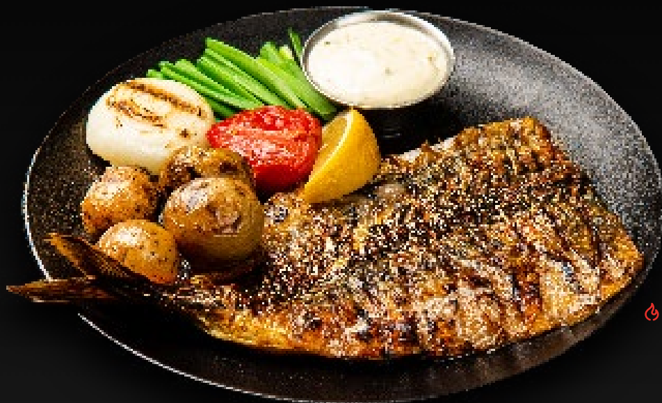
СКУМБРИЯ НА ГРИЛЕ 850 с печеными овощами