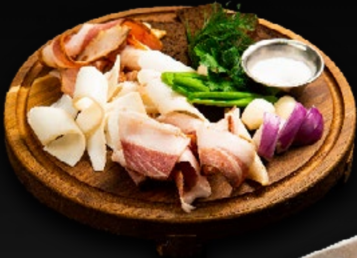
АССОРТИ ИЗ ТРЕХ 750 ВИДОВ САЛА