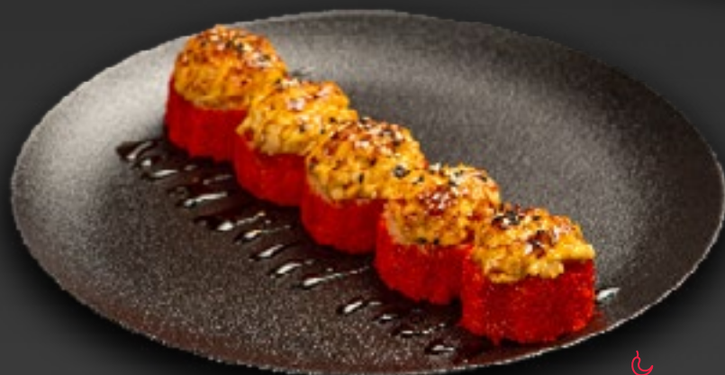
ЗАПЕЧЕННЫЙ РОЛЛ С ОСТРЫМ ЛОСОСЕМ / С ОСТРЫМ КОПЧЕНЫМ УГРЕМ 890